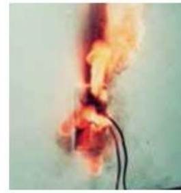
トラッキング現象による火災